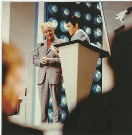
V soutěžním pořadu švýcarské televize „Dopplter oder nüt“